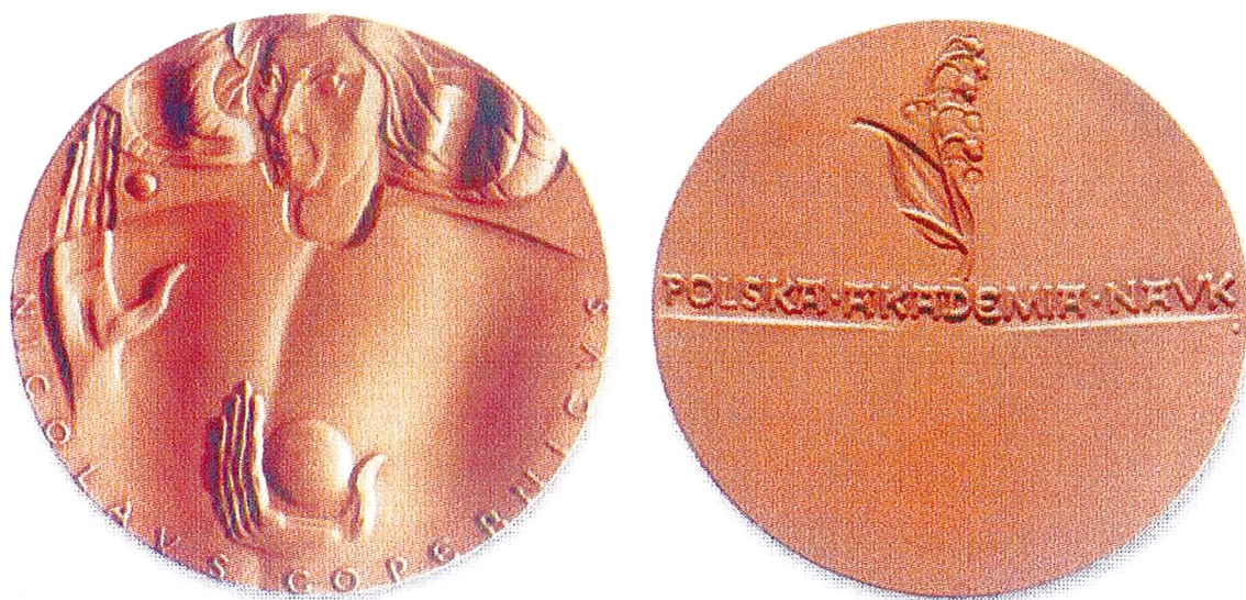
The Copernicus Medal

Załącznik nr 1 do uchwały nr 9/2011. Prezydium PAN z dnia 22 lutego 2011.